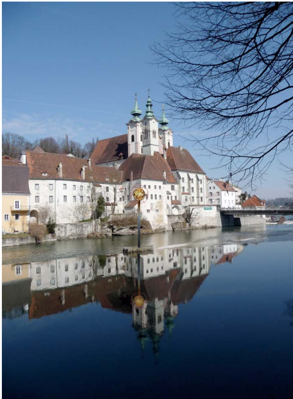
Der „Steyr Gold Kristall“ spiegelt sich auf dem Flusspodest